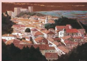
史感 (古都オビドス) 〈P100〉